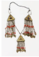
Сурет 3 КІП 26911/4 «Шекелік» – ұлбардыңты сынғынықтағы, ақ тасы бар, 3 ұлбардыңтын тұрғысы, ақ түсті дөңгелек тастармен безендірілген, арқасысында 3 маңдық тасы бар, тесеметрлік өрнек. Зергерлік бұйым жергілікті, тоқу, тапшылу дәстүрінде жасалған. Құрамында: Ақ түсті шекелік, шарақтар. Ұзындығы – 35 см, ұлбардыңтын шоғырлығы – 6,7x4 см (ҚР Мемлекеттік орталық музей қалыңдығы, «Қызылдар» институтында).