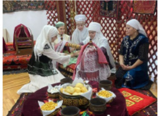
Рис.2 «Бесікке баяу» (Қазақстан).

Бұдан бөлек, музей қорындағы этнографиялық сипаттағы көптеген басқа да заттар екі халықтың мәдени байланыстарын айқын сипаттайды. Халықтың дүниетанымы, эстетикалық және рухани принциптері көрініс тапқан тарихи артефактілердің құндылығы ерекше. Қазақтар мен қырғыздардың, сондай-ақ түркі халықтарының мәдениетінде түрлі типтер мен формалармен ерекшеленетін сан алуан зергерлік бұйымдар болғаны тарихта мәлім.