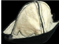
Сурет 6. КП 502. Айыр қызық, XIX ғ. Ташықары иілі, бармақ, иілді мата. Ақ ташықары иілінен жасалған, ер адамның бас киімі. Үшбұрышты ұзақ төрт сәйден құрылған төбесі дәңгеленіп келген. Қалпақтың қайырмағы қара бармақпен әдістелген, астыңғы жаққа иілдінен салынған. (ҚР Мемлекеттік орталық музейі қорына).