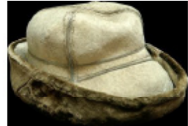
Сурет 7. КП 16042. Ташықары, бармақ, иіл. Алматы обл. ХХ ғ. орт. Ісмері Х. Құдықсына (албын). Ақ ташықары иілінен тігілген, ер адамның бас киімі. Жалпақ төбесі төрт сәйден құрылған. 1979 ж. ҚР Мемлекеттік орталық музейі этнографиялық бұйымдары бұйымдары Алматы обл., Нарынқара ауд., Воронцовка ауылы тұрғыны Шығайбековтің алығаны. (ҚР Мемлекеттік орталық музейі қорына).

Қазақтар мен қырғыздардың арасында ең көп тараған ішекті және ұзын мойынды музыкалық аспаптардың бірі «домбыра» және «комуз» (Сурет 8, 9). Айта кетерлігі, бұл аспаптар типологиялық жағынан түркі тектес халықтардың, соның ішінде әзірбайжанның «гопуз», башқұрттың «думбыра», түріктің «копуз», құмықтың «агач-комуз», хакастың «хомыс», якуттың «тангсыр» және т.б. секілді музыкалық аспаптарына ұқсас.