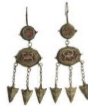
Сурет 4. КІП 26735/12. Шекелік шекелік. Жігерлік аяғында 2 үлкен шарының бір бұйымға функционалмен безендірілген, төменгі жағында – шарының көлемдерімен көлемділік қалыңдығы, ортасында тілбұйымға тақта ілуі. Шекелік тақтасында жасалған розеткалардың ұлбардыңтын ішінде тұр тарық жерлеріне сәйкестік, безендірілген. Ақ шекелік, шарының, функционал, ақу, ілу. (ҚР Мемлекеттік орталық музей қалыңдығы).

Бүгінде еліміздегі музейлердің қорында Қазақстанның тұрғындары тапсырған бірқатар қырғыз әшекейлері бар. Соның ішінде, Орталық мемлекеттік музей қорына бір кездері Ақмола облысы Жарқайың ауданы Державинск қаласының тұрғындары Найзабеков Б.С. және Найзабекова Бибігүл «Шекелік» (КІП 26911/4) зергерлік бұйымын тапсырған, бұл өз кезегінде екі халық арасындағы мәдени байланысты нығайтуға үлкен септігін тигізуде. Өз кезегінде күмістен жасалған мұндай зергерлік бұйымдар ұлттық мәдениеттің негізгі және маңызды бөлігі ретінде дәстүрлі мәдениетпен тығыз байланысты. Бұл әшекейлерді жасаудың техникалық сипаттамасы мен безендірілуінің астарында сәндік-эстетикалық ғана емес, қасиетті-сиқырлы және қорғаныс-функционалды мән жатқанын айтуға болады. Мәселен, қазақтар мен қырғыздардың ежелгі сенімдеріне сәйкес «шашбау», «шолпы» және «шекелі» секілді әшекейлердің сыңғыры қыздарды зұлым күштердің ықпалынан қорғап, олардың зиянды әсерінен сақтаған (Абрамзон, 1978).