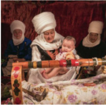
Рис.1 «Бесікке баяу» (Қырғызстан).