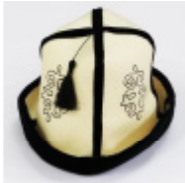
Сурет 5. Фото КП 28234/4 Қызық, ХХ ғ. сәуір. Ақ ташықары иілінен жасалған ер адам бас киімі. Жалпақ төбесі төрт сәйден құрылған. Сәйлердің арасынан тігісіне қара бармақ салынған, сәйлерінің ортасынан иркі жіптен өрнек тігілген. Қалпақтың қайырмағы қара бармақпен әдістелген, астыңғы жаққа иілдінен салынған. (ҚР Мемлекеттік орталық музейі қорына).

Қазақ дәстүрінде дала ақсүйектері – хандардың, сұлтандардың киімінің бір бөлігі болып саналатын ерлердің салтанатты бас киімі – «мұрақ» ерекше орын алады. «Мұрақтың» құрылымы қалпақпен ұқсас келеді және айырмашылығы оның жиегінің кеңірек болуында, ол жоғары қарай иілмейді. «Мұрақ» алтын-күміс жіптермен тігілгендігімен ерекшеленіп, халық арасында «мұрақ» атауы «айыр қалпақ», «сәукеле қалпақ» сияқты атаулармен де қатар қолданады (Қазақтың дәстүрлі киім-кешегі, 2009: 18).