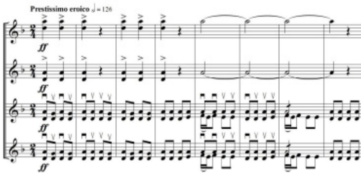
Оркестрлік нұсқа 7

Мұндай ырғақтық айырмашылықтар екі нұсқаның барлық буындарында кездесіп отырады. Ал күйдің сағасындағы әуеннің екі нұсқасына да толығымен синкопа ырғағы пайдаланылған.