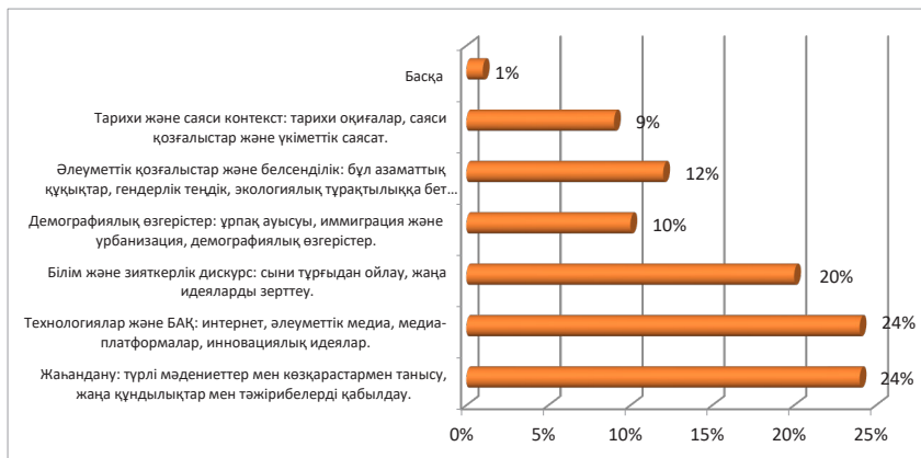
Кесте-3. Қоғамдағы дәстүрлі және инновациялық құндылықтардағы өзгерістерге әсер ететін нақты факторлар?

Жалпы, жаһандану мен интернет желісі, өзгермелі демография және технологиялық жетістіктер біздің заманымыздың негізгі қозғаушы күштерінің бірі болып табылады және осы құбылыстар біздің болашағымызды қалыптастырады. Жастар осы сын – қатерлерге қарсы тұруға және заманауи әлемнің жаңа мүмкіндіктерін пайдалануға дайын болуы керек. Жаһандану үдерісі және жалпы әлемдегі құндылықтар дағдарысы жастарға құндылыққа негізделген білім беруді және тәрбие жұмысын қайта қарауды талап етеді. Қазіргі уақытта жастар мен балалардың