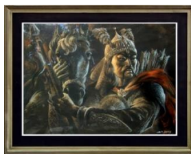
Сурет 5 – Қабанбай батыр Н.Аштема 2003ж. пастель 60x45

Суретші табиғаттың әсем бейнесін жеткізген пейзажды да, топтамалық кескіндемелерді де, көзқарас пен бейнеден адамның ішкі сырын танытатын тамаша портреттерін де өз қылқаламынан керемет туынды етіп шығара алған. Ол графиканы да сиқырлы тілмен сөйлете білді. Линография техникасы мен офортты, акварелді бояу мен тушьты ұтқыр пайдалануының арқасында шығармаларына жан бітірер сиқыршы сияқтанады.