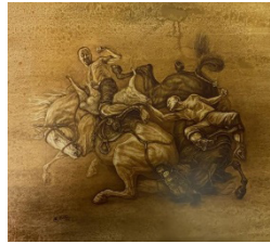
Сурет 1 – Көкпар Н. Бажиров 2011 торшон аралас техника 170х90см.

Онымен қоса, Н.Бажировтың еңбектері – өздерін Табиғат Анамен етене тұтас сезінетін адамдар, оның бейнелеген асау арғымақтарынан басқа – гепардтар, тарлан қасқырлар, азулы иттер (Тазы, Арлан қасқыр), адамдар секілді текті, сұсты, саликалы.