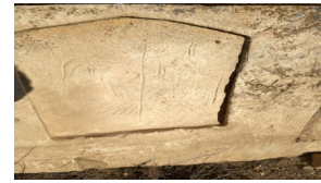
20-сурет. Бие сауу. Қарағашты әулие. (XV-XVIII ғғ.) Маңғыстау обл.

Құлпытастардағы жылқылардың дені ерттелмеген, үстінде иесі жоқ тұл немесе тағы жылқыларды елестетеді. Бұндай суреттердің семантикалық кеңістігі нені меңзейді? Үстінде иесі жоқ тұл ат – өлім концептісіндегі негізгі фреймдердің бірі. Иесі өлген атты жал-құйрығын кесіп, тұлдау қазақ салтында XIX ғасырдың екінші жартысына дейін сақталғандығы туралы М.Әуезовтің «Абай жолы» эпопеясы арқылы жақсы таныспыз. Аттың ерттелмеуі – оның адамзат құрығына түспеген тағылығын, еркіндігін көрсетеді. Сондай-ақ, мифтанушы С.Қондыбай «ерт, ерттеу» сөзінің түпкі этимологиясын «рет, тәртіп, жөн-жосық» сөздерімен байланыстыра келіп: «Жабайы, асау ат – хаос, тәртіпсіз ғалам. Оны қолға үйрету немесе ерттеу – хаосты жойып, тәртіп пен космос орнату болмақ» (Қондыбай, 2008: 344), – деп жазады. Сонда қабір басына салынған жылқы бейнесі хаос, яғни өлілер дүниесін мензесе керек.