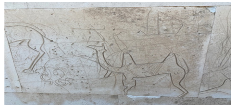
12-сурет. Мойнында белгісі бар қос өркешті түйе Шекем Мейіз (XIX ғ.), Маңғыстау облысы