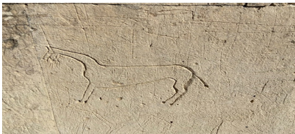
9-сурет. Тұмар тағылған ат. Шекем Мейіз (XIX ғ.) Маңғыстау обл

Маңғыстау жерлеу орындарында жекеленген тұлғаларға салынған кесене қабырғаларында, құлпытастарда, сандықтастарда жылқы, түйе, арқар, таутеке, арыстан, жолбарыс , егер жерленген ер адам болса, бес қару түрлері немесе марқұмның кәсібіне байланысты қайшы, тарақ, етік т.б., діни тұлғалар болса, ашық алақан, құран салатын қоржын т.б. ойып, қашап, бедерлеп салынған (9-10-11-12-13-14-15-16-17-суреттер).