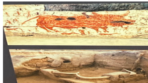
27-сурет. Аң аулау. Стамбул университетінің археологиялық музейі