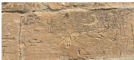
13-сурет. Айға атылған арлан бөрі Күйеу там (XVI-XVII ғғ), Маңғыстау обл.