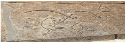
21-сурет. Жалғыз өркешті нар мен еркек бота және имур, салор тайпаларының таңбалары Күйеу там (XVI-XVII ғғ.) Маңғыстау обл.