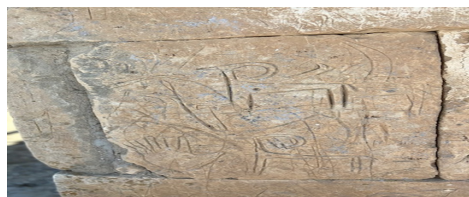
14-сурет. Арқарлар және ашық алақан бейнесі Күйеу там (XVI-XVII ғғ), Маңғыстау обл