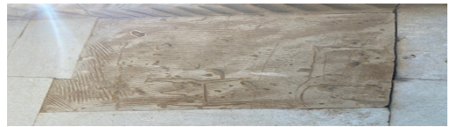
22-сурет. Қос өркешті айыр түйе. Жарылғас Ата (XIX ғ.) Маңғыстау обл.