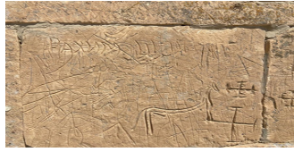
24-сурет Арлан бөрі, айғыр және жәуміт, қынық, салор тайпаларының таңбалары Күйеу там (XVI-XVII ғғ.)