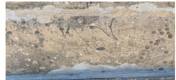
28-сурет. Аң аулау. Жарылғас Ата (XVIII ғ.)

Арыслантепе (Ефрат өзенінен оңтүстік батысқа қарай 12 км қашықтыққа созылып жатқан Малатъя жазығы, қазақша – Арыстан төбе) археологиялық қазбадан адамдардың бизон әлде алып қабан аулаған суреті табылған (Стамбул археологиялық мұражайы). Осыған ұқсас «алып аң аулау» сценасын экспедиция барысында ХҮІІІ ғасырда салынған Жарылғас Ата кесенесінен таптық. Бұл Маңғыстау жерлеу орындарындағы «атқа мініп аң аулау», «бие сауу», «ботасын емізген інген» сияқты сюжетті суреттерді жаңа тақырыппен байыта түсетіні сөзсіз. Бірақ бизон, қабан сияқты алып аңдарды аулау сценасы Маңғыстау жерлеу орындарында аса көп емес. Маңғыстау жерлеу орындарында (құлпытастарда, сандықтастарда, кереге там, кесене қабырғаларында) адам бейнесі көп кездеспейді, негізінен ат үстіндегі салт ат-