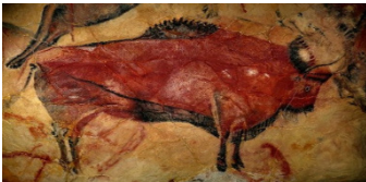
26-сурет. Ласко үңгірінен табылған сурет «Аңшылық»

Маңғыстау жерлеу орындарында бұқаның суреті кездеспейді. А.Медоев мұз дәуірінің аяқ шеніне қарай мүйізтұмсық алғашқы бизон мен алғашқы сыйыр тұқымдас түрлердің құрып бітуіне байланысты олардың жартаста бейнелеу дәстүрі Сарыарқада тоқтап қалады да жаңа тас ғасырының аяқ кезінде Сарыарқаның жартастас беті өнерінде бұқа бейнесі қайта көрініс беретінін жазады (Медоев, 1979: 169). Зерттеушілер М.К.Кадырбаев пен А.Н. Марияшев археологиялық қазба деректеріне сүйеніп, түрлердің қаңқалары неолит, қола дәуірі ескерткіштерінен табылған, ал Қазақстанда жартастас бетінде бұқалардың (бизондардың) бейнелене бастауы шамамен б.э.д. II мың жылдықтардың арғы жағында болуы керек, Н.К.Верещагин мен Н.Н.Мельникованың деректері бойынша, Алтайды түрлар XVIII ғасырдың ортасына дейін мекендеген деген пікір айтады (Кадырбаев, Марияшев, 1977: 171-172). Франциядағы Ласко үңгірінен табылған Ежелгі палеолит дәуірі адамдары салған «Аңшылық» деп аталатын суреттерде адамдардың алып бизондарды аулау сәті бейнеленген.