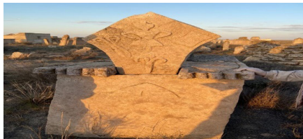
29-сурет. Сандықтас үстіне қойылған құлпытастағы әйел бейнесі. Сейсем Ата пантеоны, Маңғыстау.

Экспедиция мүшелерінің ерекше назарын аударған бір құлпытас туралы айтып өткіміз келеді (29-сурет). Сейсем Ата пантеонында үлкен сандықтастың (саркофаг) бас жағына трапеция формасында орнатылған құлпытастың дәл ортасында әйел адамның бейнесі бедерленген. Шашын төбесіне түйген, бет жүзі жоқ (жел, жаңбыр әсерінен өшіп кетуі де мүмкін), екі қолын бүйіріне таяу ұстаған, етегі трапеция, жіңішке белінде белбеуі бар, аяқтары түп-түзу, қысқа. Айналасында үлкен қайшы, тарақ және шаш түйреуіш бедерленген. Құлпытастың төменгі жағында, сандықтастың бетінде адай таңбасы – жебе ойып салынған. Сандықтастың қақпағын мүк басып, қарайған. Марқұмның аты-жөні туралы дерек жазылмаған. Суреттерге қарап мынадай болжам айтуға болады: бұл жерде жерленген – әйел адам, ол өмірде тігіншілікпен айналысқан шебер немесе шаштараз болуы мүмкін. Ана дүниеде де кәсібін жалғастырады деген сеніммен қабіріне оның тірідегі құралдары бейнеленген. Қазақта тағы да мынадай наным бар: өмірде қолөнермен айналысқан (тоқыма, кілем, алаша тоқитын, киім тігетін, киіз үйдің құрал-жабдықтарын жасайтын шебер) әйел адам қайтыс боларда қолымен жасаған дүниелерін, құралдарын қимай, біразға дейін жаны шыға алмай қиналатын көрінеді, сол кезде жанына әкеліп, инесін, алаша, кілем тоқитын құралдарын сындырып, жіптерін қиса, адамның жаны жеп-жеңіл шығып кетеді. Мына құлпытастағы суреттерде осы нанымның іздері де болуы мүмкін.