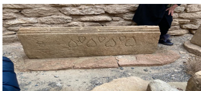
15-сурет. Құлпытастағы суреттер Белтұран (XI-XV ғғ), Маңғыстау обл.