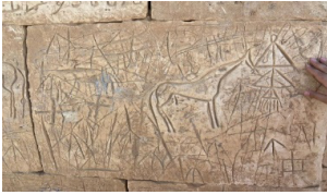
23-сурет. Айғырдың суреті және әйелдердің әшекейі