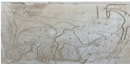
11-сурет. Қатепті нар Шекем Мейіз (XIX ғ.) Маңғыстау облысы)