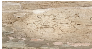
19-сурет. Атка мініп, аң аулау Кентті Баба (X-XV ғғ.), Маңғыстау обл.