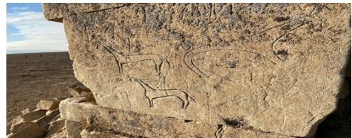
10-сурет. Кесене қабырғасына салынған жылқылар Қарауылкүмбет (XIV ғ.) Маңғыстау облысы.