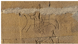
18-сурет. Ат үстінде үзенгіге тұрып, ат шылбырын ұстаған адам Жұбанияз Ата (XVIII ғ.), Маңғыстау облысы

бірден-бір киелі құрал. Оның да ар жағы өмір ағашымен байланысты. Үй артында жылқы байлайтын бағанды қазақтар мама ағаш дейді. Мама ағашы, мама бие атауларындағы мама сөзі Ұмай Ана ұғымымен байланысты. Бұл да жылқының Тәңірлік, аспандық, ана дүниелік сипатын танытады. Өмір ағашы ислам дініндегі сидрат аль-мунтаха – пейіште өсетін ғажайып ағаш туралы түсінікпен астасады. Архаикалық мәдениетке тән дүниенің мифтік бейнесі кейінгі дәуірлерге мәдениеттің бір деңгейі немесе үлгісі ретінде жетті. Оның мысалы ретінде қазақ эпостарындағы мифтік персонаждарды айтуға болады (Нұрдәулетова, Режепович, Жанат, Нұржанова, 2020: 763).