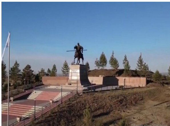
Сурет 4. Өскемен қаласының кіреберісінде орналасқан Қабанбай батыр ескерткіші

Айта кетерлігі, тұрғындар батыр мүсінінің қала сыртына орнатылу себебі «ақ найзаның ұшымен, білектің күшімен қорған болып, ел тыныштығын сақтап тұрғандай», – деп пікір білдіруде. Дегенмен, Қабанбай батырдың «жаудың өтінде, жердің шетінде боламын» сөзі бар. Қабанбай батыр ескерткіштерінің кіре берістерге немесе жол қиылыстарына қойылуының себебі осында шығар. Яғни, «мен елімнің, халқымның қорғанышымын» деп тұрғандай. Ескерткіштің символикалық мағынасы өскелең ұрпақтың ұлттық санасын жаңғырту демек, бұл тек естелік орыны ғана емес, сонымен қоса болашақта түрлі мәдени-ғылыми іс-шаралар өткізілетін алаңға айналмақ.