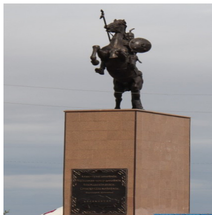
Сурет 3. Тарбағатай ауданының Омск–Майқапшағай тас жолында орнатылған Қабанбай батыр ескерткіші ((автордың түсірген суреті, 2021)

Қабанбай батырдың келесі ескерткіші 2012 жылы Тарбағатай ауданының Омск–Майқапшағай тас жолының бойында Тарбағатай ауданына бұрылысындағы Боғаз бекетінде қойылған (Сурет 3). Ескерткіш «Менің бабам – Қабанбай батыр» қорының қаражатынан тұрғызылған. Батыр ескерткішін орнату бойынша қорға қаражатты барлық аудан тұрғындары жинаған. Жергілікті тұрғындардың айтуы бойынша батырдың ескерткішінің ашылу салтанатында ауданда ас беріліп, аламан бәйге өткізілген. Бұл ескерткіште ат үстіндегі батырдың бейнесін көрсетеді. Ескерткіштің өзгешелігі Қабанбай батырдың атының алдыңғы аяқтары биік көтерілген. Барлық ескерткіштерде баяу жүріп бара жатқан ат бейнеленсе, мына ескерткіште аттың батылдығына екпін қойған.