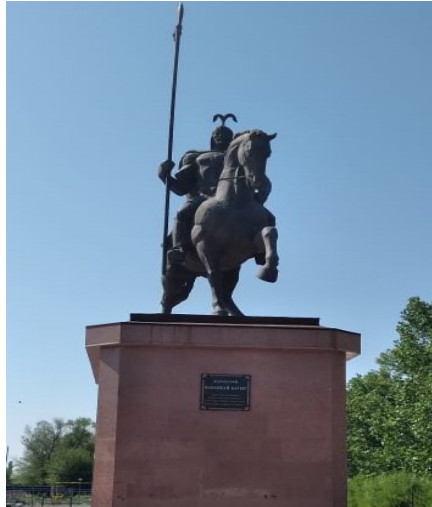
Сурет 2. Мақаншы ауылының орталық саябағында орналасқан Қабанбай батыр ескерткіші (автордың түсірген суреті, 2021)

Қабанбай батырдың келесі ескерткіші 2012 жылы Тарбағатай ауданының Омск–Майқапшағай тас жолының бойында Тарбағатай ауданына бұрылысындағы Боғаз бекетінде қойылған (Сурет 3). Ескерткіш «Менің бабам – Қабанбай батыр» қорының қаражатынан тұрғызылған. Батыр ескерткішін орнату бойынша қорға қаражатты барлық аудан тұрғындары жинаған. Жергілікті тұрғындардың айтуы бойынша батырдың ескерткішінің ашылу салтанатында ауданда ас беріліп, аламан бәйге өткізілген. Бұл ескерткіште ат үстіндегі батырдың бейнесін көрсетеді. Ескерткіштің өзгешелігі Қабанбай батырдың атының алдыңғы аяқтары биік көтерілген. Барлық ескерткіштерде баяу жүріп бара жатқан ат бейнеленсе, мына ескерткіште аттың батылдығына екпін қойған.