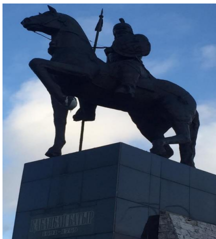
Сурет 1. Семей қаласында теміржол вокзалында орналасқан Қабанбай батыр ескерткіші (автордың түсірген суреті, 2021)