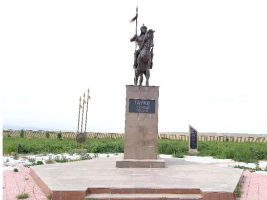
Сурет 7. Тарбағатай ауданы Ақжар ауылында орналасқан Тәуке батыр ескерткіші (автордың жеке мұрағатынан, 2019 ж)

Ұжымдық естеліктің, жергіліктік бірегейліктің тағы бір көрінісі – Тарбағатай ауданында орнатылған Тәуке батыр ескерткіші (сурет 7). Ескерткіш «Рухани жаңғыру» бағдарламасы аясында 2019 жылы Тәуке батырдың 340 жылдық мерейтойына орай орнатылды. Тәуке батыр тарихта батырлығымен қатар күйші, ақын әрі шешендігімен белгілі болған. Ауыл тұрғындарының пайымдауынша ескерткіш ашылған күні батыр баба рухына тағзым еткен шара барысында ақындар айтысы өткізіліп, ұлттық ойындар ойнатылды, ғылыми-тәжірибелік конференциялар өткізілді.