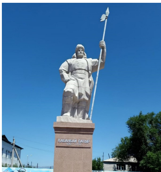
Сурет 5. Ұржар ауданында орналасқан Қабанбай батыр ескерткіші

Қаракерей Қабанбай батырдың жаңа ескерткіші Абылайхан даңғылының бойында аудандық әкімдік ғимаратына қарама-қарсы тұрған орталық алаңда орнатылған (Сурет 5). Бұл ескерткіш өзге батырлар ескерткіштерінен өзгеше. Жоба авторы К.Шалабаевтың пікірінше, «Найзаның ұшымен, білектің күшімен» деген пікірмен, Абылайханның бас сарбазы Қабанбайды «Мәңгілік елге» аяқ басқан батыр ретінде жаяу тұрған батыр ретінде сипатталған. Ат үстінде отырғызылып орнатылған батырлар ескерткіштері бір біріне ұқсап кеткен, ажырату мүмкін емес. Сол себепті автор бұл ескерткішті барлығынан өзге етіп бейнелеуге тырысқан. Қазбалай берсек кемшілік табылады. Дегенмен, алғашқы атсыз батырдың бейнесі сәтті шықты деп айтуға болады.