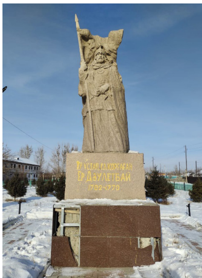
Сурет 6. Тарбағатай ауданы Ақжар ауылында орналасқан Ер Дәулетбай батыр ескерткіші

қарсаңында 2015 жылы мамыр айында «Бірлігі мықты ел озады» марафонды шеру аясында ашылды.