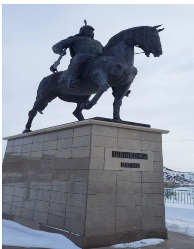
Сурет 11. Аягөз ауданында Шыңқожа батыр батыр ескерткіші