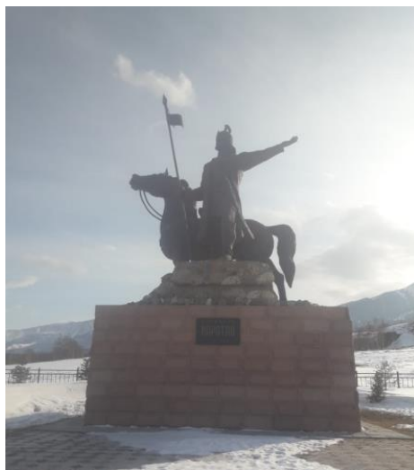
Сурет 8. Катон-Қарағай Қаратай ауданында Қаратай Көкжарлыұлы батыр ескерткіші (автордың жеке мұрағатынан, 2015)