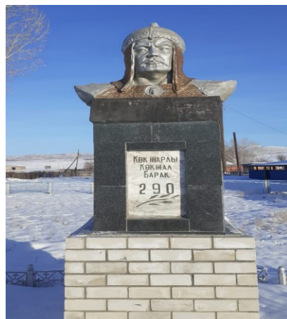
Сурет 10. Күршім ауданындағы Теректі бұлақ ауылы Көкжал Барақ батыр ескерткіші

( Шығыс Қазақстан облысының үлкен аудандарының бірі болып саналатын Аягөз ауданы ескерткіштер мен түрлі таңбаларға бай өңір. Аягөз ауданының Нарын ауылдық округінің Шыңқожа ауылында Шыңқожа батыр ескерткіші орнатылған (сурет 11). Батыр ескерткіші еліміздің айтулы күніне орай яғни Қазақстан Республикасының Тәуелсіздігінің 25 жылдығының қарсаңында ашылған. Қазақтың хас батыры Шыңқожа Базарқұлұлының ескерткіші Алматы – Өскемен жолы бойында орнатылған. Ескерткіш орнатылған күні «өлі разы болмай тірі байымайды» деген ниетпен ауыл тұрғындары батыр аруағына арнап құран бағыштап ас берілген. Шыңқожа батыр ескерткішін салтанатты ашылуна орай «Шыңқожа батыр және Аягөз өңірінің әдеби-мәдени шежіресі» тақырыбында конференция өткізілген.