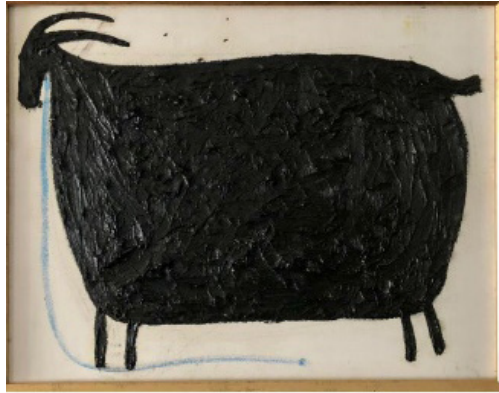
2-сурет. Ә. Бапанов.

«Әлібай Бапанов бейнелеу формаларын пластикалық стильдеу және оларды бірыңғай стильдік шешімге бағындыру өнерін жетік меңгерген. Суретшінің бұл қасиеті, сондай-ақ бейнелеу элементтерінде болашақ шығарманың көркемдік бейнесін шебер таба білуі, тақырыптар мен сюжеттерді таңдаудағы жоғары мәдениеті – қазіргі қазақ гобелен өнеріндегі минимализм эстетикасының мәдени құбылысының дамуына негіз болды» (Муканов, 2020: 239-240). Дәл осы шеберліктің нәтижесі ретінде, Ә.Бапановтың жаңа туындысы сыртқы қарапайымдылығы және абстракциялық стиліне қарамастан, терең семиотикалық қабаттарға ие. Туындыда қара түсті, төрт аяқты жануардың (ешкінің) абстракцияланған бейнесі сомдалған. Семиотикалық талдау жасағанда, туындыда қолданылған түстер, пішіндер және сызықтар арқылы бірнеше маңызды символдық мағыналар ашылады.