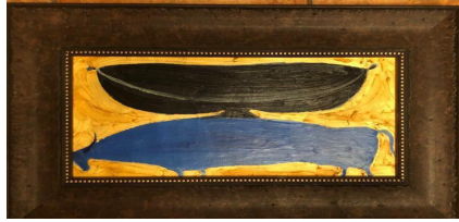
4-сурет. Ә. Бапанов. Тайқазан (2017)

күрделі тұстарын, оның ішкі әлемінің шектеулерін, қайғыларын, таңдау мен өзгерістерін көрсетуге ұмтылады. Бұл шығарманың мәні көп қырлы, өйткені ол тек көркем тұрғыдан ғана емес, сонымен қатар адам болмысының терең философиялық аспектілерін талдауға мүмкіндік береді.