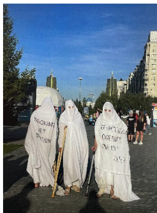
«Aduг-aspaн» Көрінбейтін суретші. 2023

«Aduг-aspaн» тобының келесі жұмысы 2023 жылы Астана көшелерінде орындалған «Көрінбейтін суретші» (Невидимка). Перформанстың идеясы отандық суретшілердің Заң алдындағы, Суретші құқығы қорғалмағандығы жайлы еді. «Aduг-aspaн» өкілдерінің бұл акциясының салмағы да ауыр, себебі өнер қайраткерлерінің ойында жүрген мәселесін көтерген: біріншісі, суретшінің қоғамдық ортадағы рөлі болса, екінші мәселесі, бейнелеу өнеріне жаны жақын, талантты жасөспірімдерге мәдениет ошағы, нақтырақ айтсақ – бейнелеу өнері академиясын салып беруді сұрамақ мақсатында шеруге шыққан.