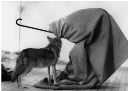
Дж.Бойс. «Қасқыр: мен Американы жақсы көремін, ал Америка мені...». 1972

Үш күннен кейін Дж.Бойс өзіне үйреніп қалған жануарды құшақтап, Америка жерін баспаған күйінде әуежайға жедел жәрдем көмегімен жеткізіледі. Суретшінің айтуынша: «мен өзімді оқшаулағым келді, өзімді қорғағым келді, Америкада қойоттан басқа ештеңе көрмедім» (ZenkoFoundation) деген. Дж.Бойстың мұндай іс-әрекетін қазақи таныммен жобаласақ, халық емшілері түрлі ару-сырқауға, жарақатқа киіз күйдіріп басқанын білеміз. Сонымен қатар, адам ауруын «малға көшіру» деген де ем түрі кездеседі. Суретшінің бұл әрекеті осы халық еміне ұқсас екендігін байқау қиын емес. Халық арасында киіздің әртүрлі тән ауруын емдейтін қасиетіне қандай сенімді болсақ, жан «жарасын» жазуға да себепші болғанын Дж.Бойстың осы ерекше шығармасынан, перформансынан анық көруге болады. Шығарманың ерекшелігі де осылай айқындалып тұр.