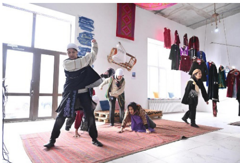
Г.Тәттібай «Ел ана». 2023

«Ел ана» перформансының мазмұны қазақ әйелдерінің тағдырын заманауи тілмен сөйлете білуімен ерекшеленді. Қазақ әйелдері – үлкен феномен. Дала мәдениетіндегі қазақ әйелдеріне тән жігерлілік, табандылық, имандылықты пен төзімділік «Ел ана» перформансында кеңінен көрсетілген.