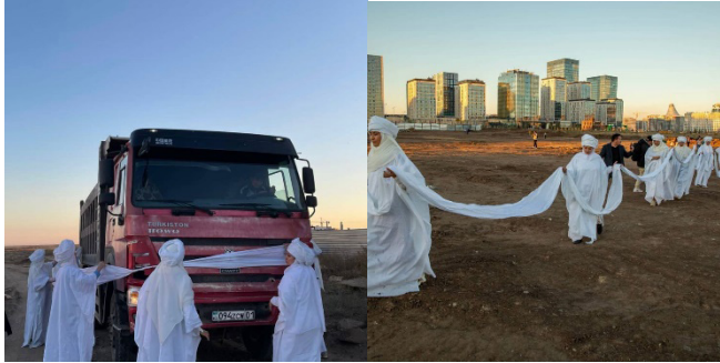
«Aduг-aspaн» «Шалқыма». 2023

2023 жылы дәл осы топтың экологиялық мәселелерді көтеретін тақырыпта орындалған тағы бір жұмысы – «Шалқыма» деп аталады.